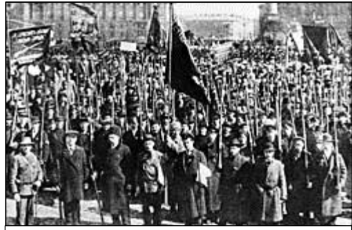
Oktoberrevolutie, 1917 in Rusland

In het Rusland van tsaar Nicolaas II zag Lenin, aanhanger van de ideeën van Karl Marx, de oplossing van de ongelijkheid in de samenleving, door middel van de Rode Revolutie . Deze revolutie zou een einde maken aan de ongelijkheid en een begin maken van echte gelijkheid .